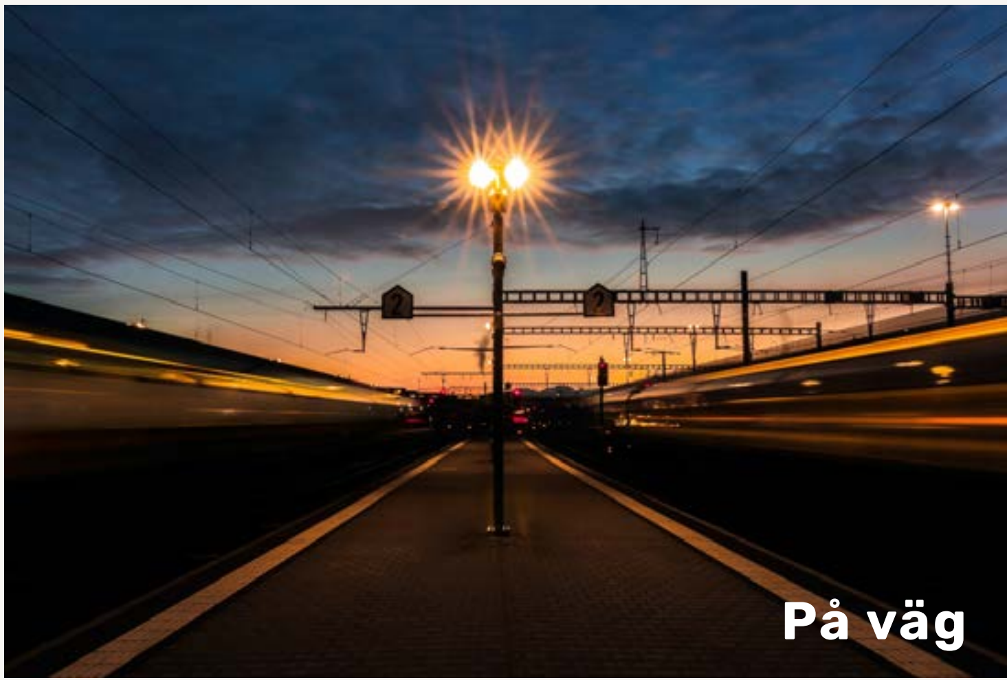
Moodboarden används med fördel som inspiration för att fånga DigIT Hubs visuella känsla